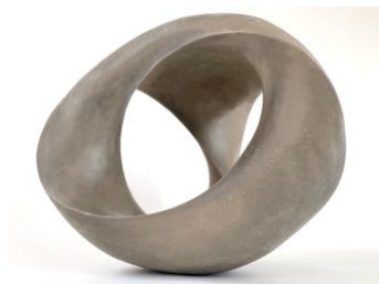
volle räumliche Ausarbeitung

Freitag, 12. August bis Sonntag, 14. August 2022